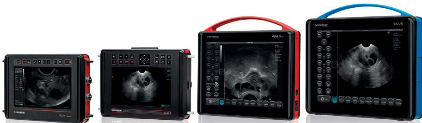
iScan 2 MULTI

Il sistema OPU è compatibile con diversi modelli di ecografi Dramiński